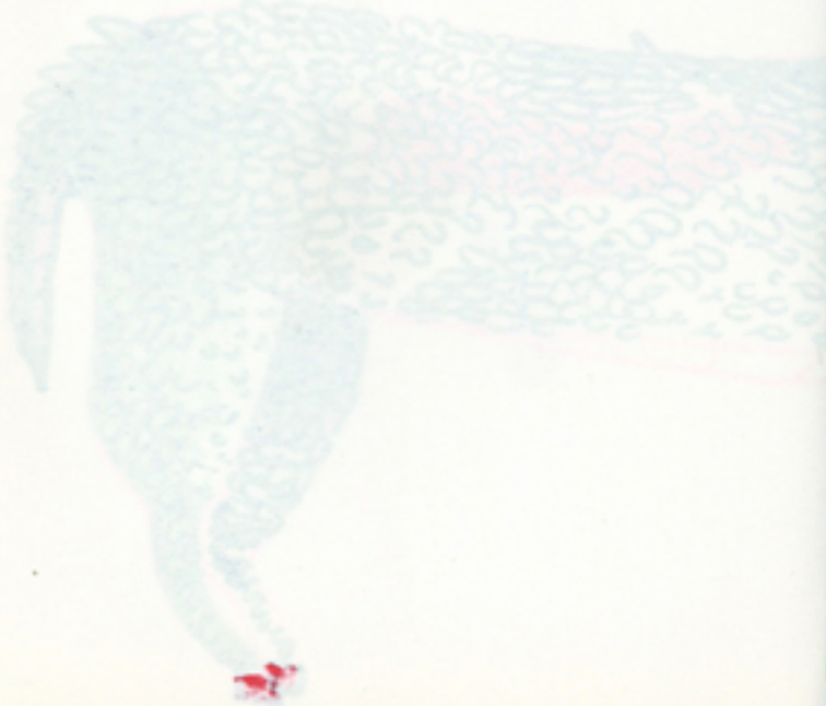
TABLA DE MULTIPLICAR